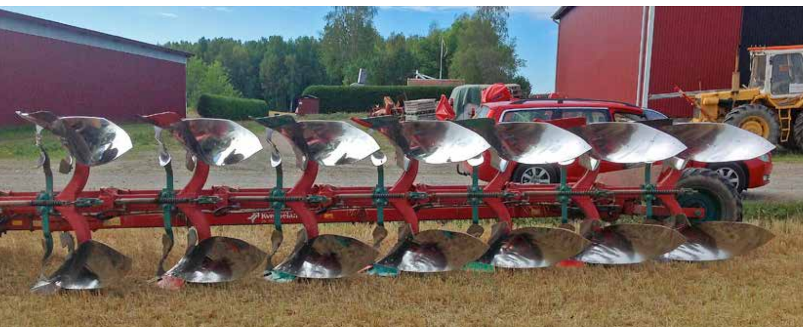
Vores test plov

Det samme var tilfældet med skærene. Her gik det faktisk endnu værre for kopierne. Helt op til 55% mere slitage! Og det selvom vores dele var de letteste og tyndeste i testen.