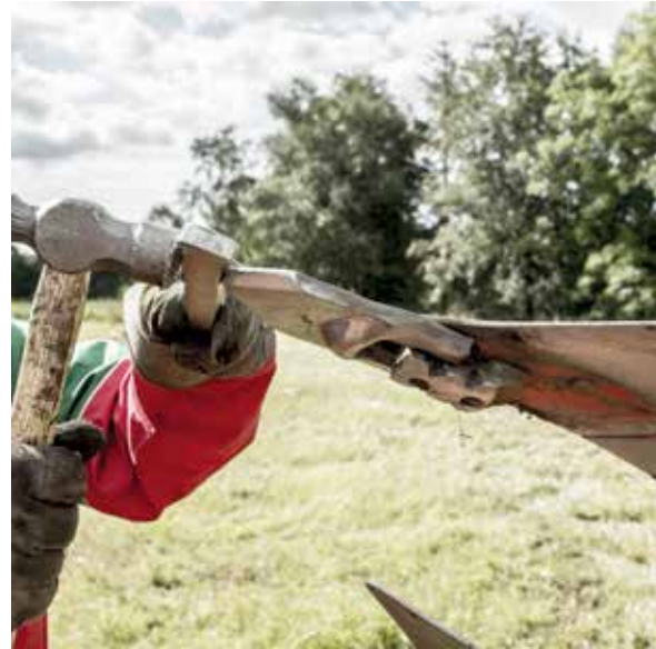
The Kverneland Knock-On® System

Hvis du ta'r ovenstående konklusioner og dertil lægger Kverneland's service med hurtig levering, vores store forhandler netværk og ikke mindst at du bevarer din garanti ved at bruge original dele – så er det svært at se hvor du sparer penge ved at købe billige kopi dele.